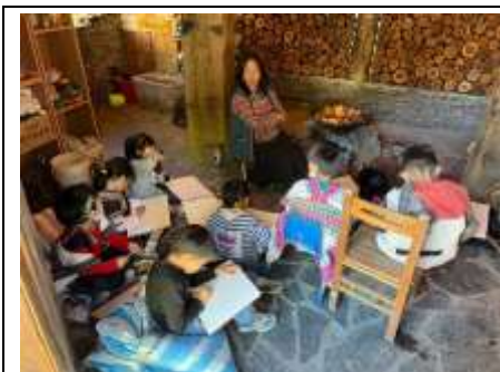
觀察學校的 Langha 裡有什麼？ 把看見的 Langha 畫下來！