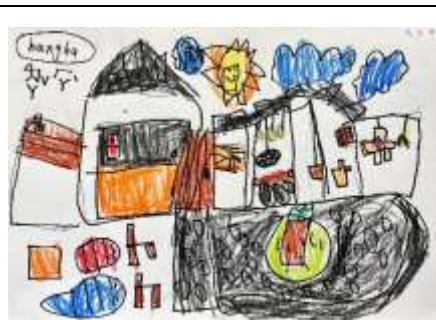
Nau 畫的 Langha