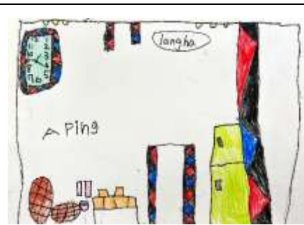
Aping 畫的 Langha