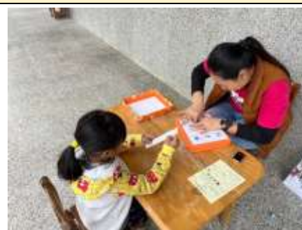
我會拚注音唸出句子