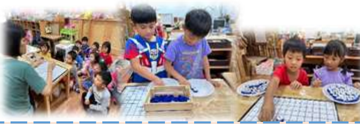
介紹數學區自製教具-狩獵棋，請幼兒實際操作