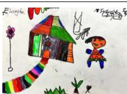
Landih 畫的 Langha