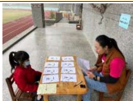
我會分辨注音的聲調