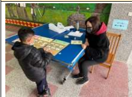
我會把注音拼在對的位置