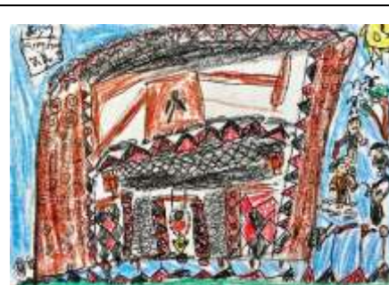
Hantal 畫的 Langha