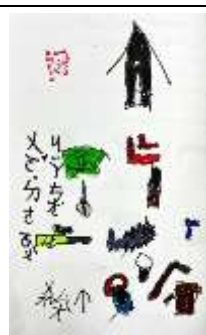
Kimat 家的 Langha