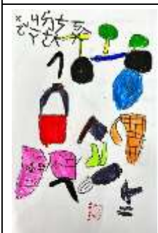
Baicu 家的 Langha