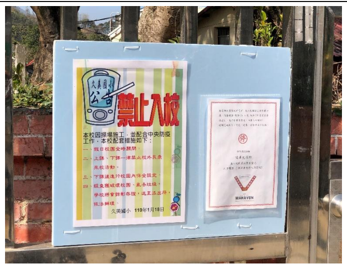
學校製作操場整建通知，請入校車子注意