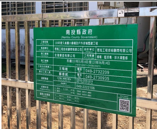
操場、籃球場整建通知