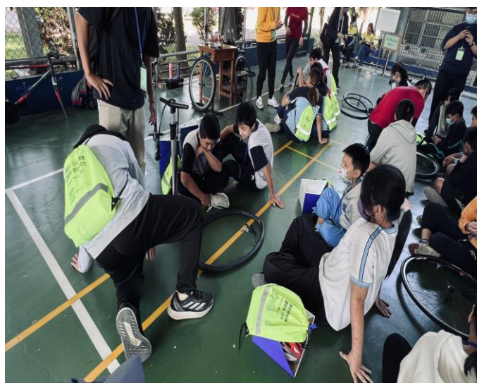
參與腳踏車換胎體驗式學習