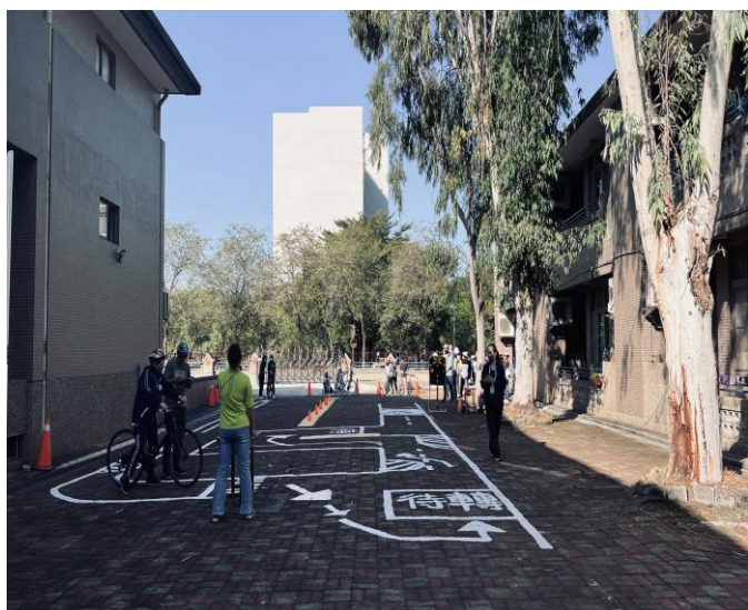
交通安全學生考照練習