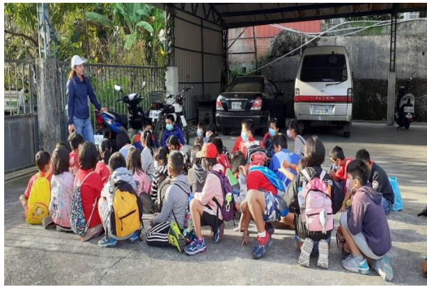
坐遊覽車前的行前教育