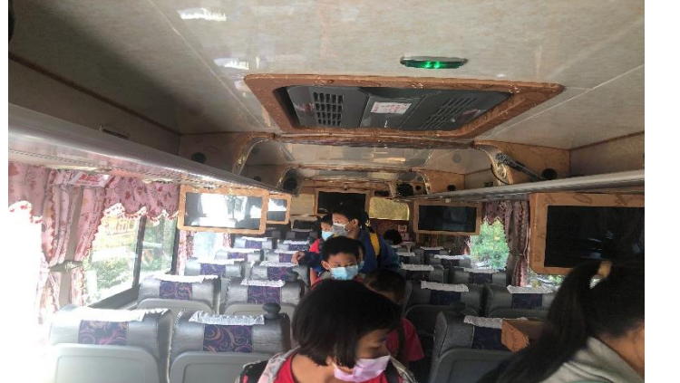
學生找尋擊破器和被敲擊的地方