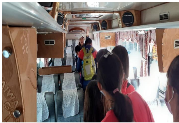
說明遊覽車的車頂逃生門