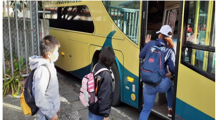
教師帶著學生走一趟逃生路線