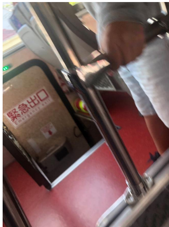
另一處的緊急出口區，藉由老師說明而學習